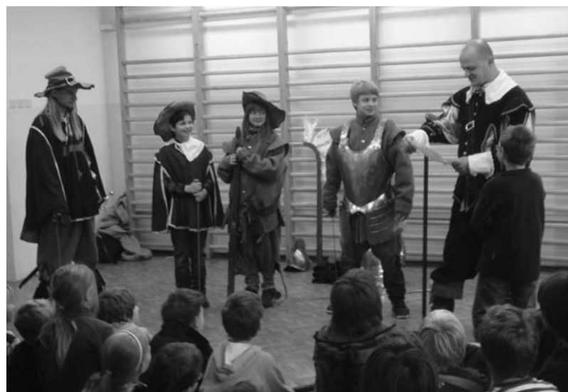
Uczniowie w ciekawy sposób poznawali historię Polski, fot. Szkoła