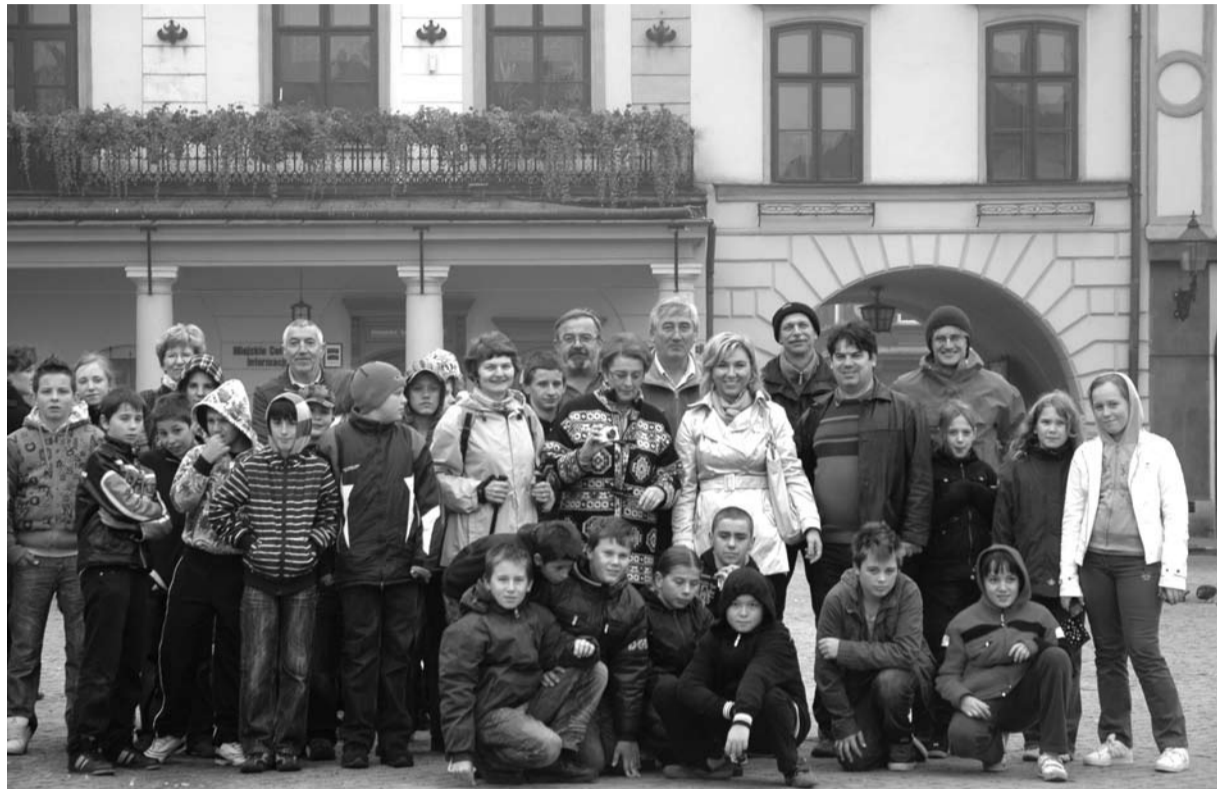
Zaproszeni goście mieli okazję zwiedzić Cieszyn

Uczniowie z zaprzyjaźnionych szkół w czasie swojego krótkiego pobytu w Polsce, mieli rów-