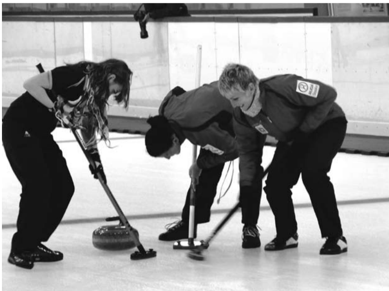
Mistrzostwa w toku