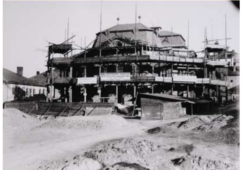
Teatr w budowie, fot. z archiwum Muzeum Śląska Cieszyńskiego

Towarzystwo Budowy Teatru po zebraniu odpowiednich funduszy – ok. 450 tysięcy koron (...) podjęło na Walnym Zebraniu w dniu 27 kwietnia uchwałę o przystąpieniu do budowy gmachu teatralnego. Budowę zdecydowano się powierzyć założonemu w 1872 roku, cieszącemu się międzynarodową sławą wiedeńskiemu atelier architektonicznemu „Fellner&Helmer”. Specjalistyczne biuro projektów i przedsiębiorstwo Ferdinanda Fellnera (1847 – 1916) i Hermanna Helmera (1849 – 1919) słynęło z budowy licznych obiektów reprezentacyjnych, użytkowych i mieszkalnych. W latach 1872 – 1915 wzniesionych zostało ich ponad 200. Co niezwykle istotne, pierwszym dziełem atelier „Fellner & Helmer” na ziemiach polskich jest budynek Liceum Ogólnokształcącego im. M. Kopernika w Cieszynie. Wśród 48 obiektów teatralnych, w projektowaniu których firma bardzo szybko się wyspecjalizowała, są następujące budynki: Teatr Narodowy i Teatr Komedii w Budapeszcie, Teatr im. Janačka w Brnie, Teatr Miejski – Dramat i Opera w Bratysławie, Teatr Miejski w Karlowych Varach, Deutsches Volkstheater we Wiedniu. Opera w Odessie, Teatr Miejski w Salzburgu, Niemiecki Teatr Dramatyczny w Hamburgu, a na ziemiach polskich teatry w Toruniu (1904) i Łańcucie. W 1905 roku także budynek bielskiego Teatru Miejskiego uległ częściowej przebudowie według projektu wiedeńskiej spółki architektonicznej. To wreszcie projekt Fellnera i Helmera zwyciężył w konkursie na teatr publiczny, ogłoszonym przez prezydenta Krakowa w 1889 roku (projekt ten nie docze-