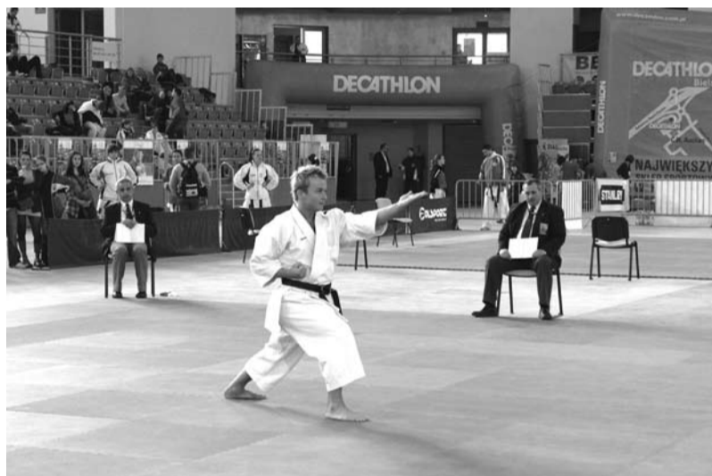
Pokaz umiejętności na macie

5 zawodników K.S. SHINDO) i były to zarazem kwalifikacje do Mistrzostw Europy, które odbędą się za miesiąc w Niemczech w Koblenji. SHINDO