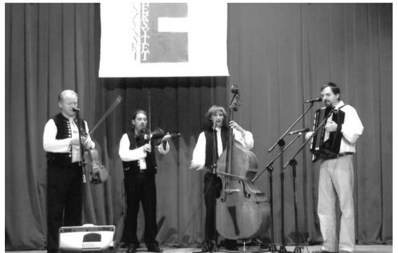
Inaugurację umilił koncert zespołu „Wałasi”