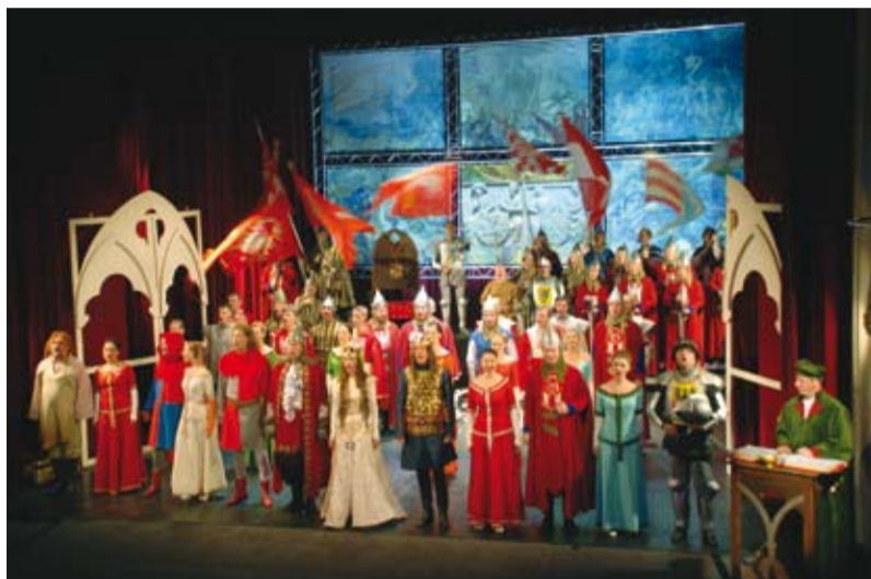
Spektakl zakończył się pieśnią odśpiewaną przez wszystkich aktorów

Barwne widowisko zgromadziło liczną publiczność, która wypełniła teatr aż do ostatniego miejsca. BZ