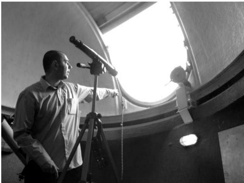
Uczniowie mieli okazję podziwiać nocne niebo przez teleskop, fot. G1