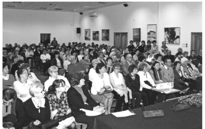
Na pierwszy wykład UTW przybyła liczna grupa zainteresowanych