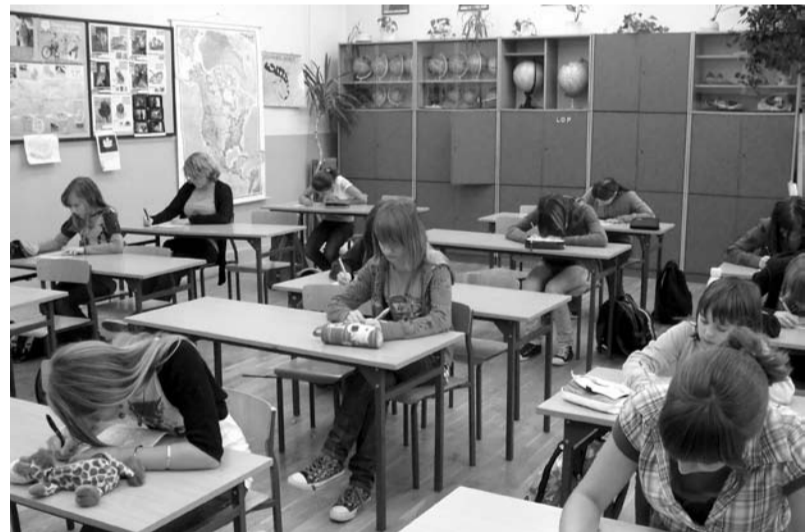
Uczniowie w skupieniu rozwiązywali test