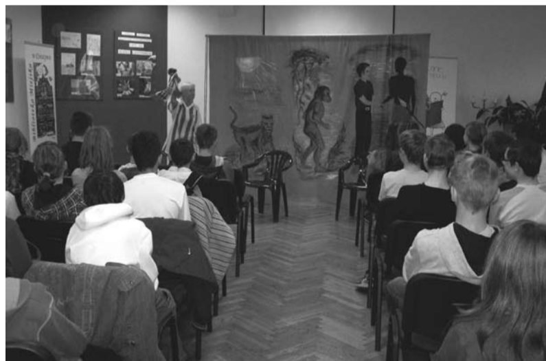
Dzieci obejrzały spektakl traktujący o problemach społecznych