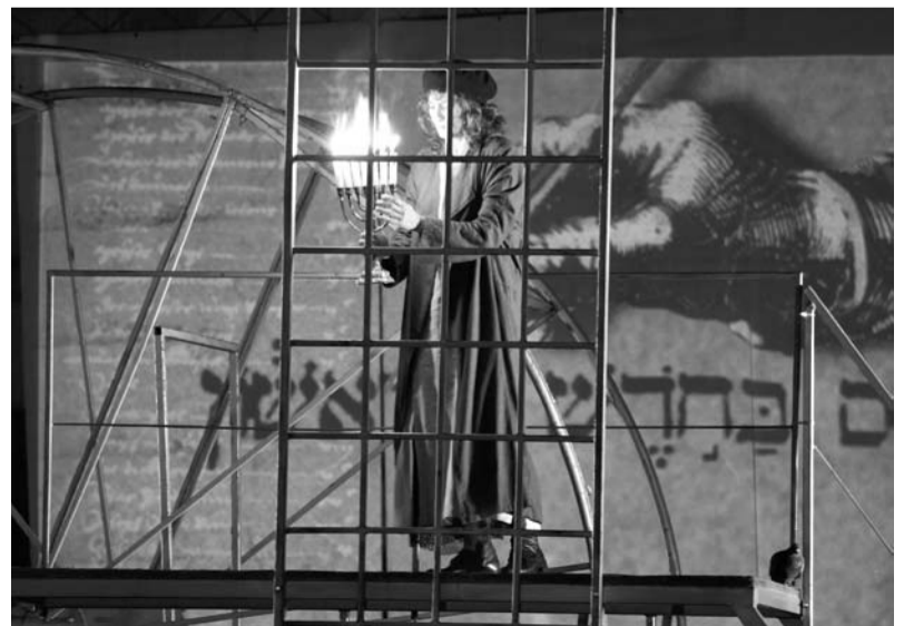
„Rabin Maharal i Golem”, fot. M. Fiedor