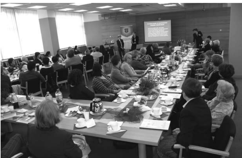
Uczestnicy konferencji dotyczącej pielęgnacji obłożnie chorych