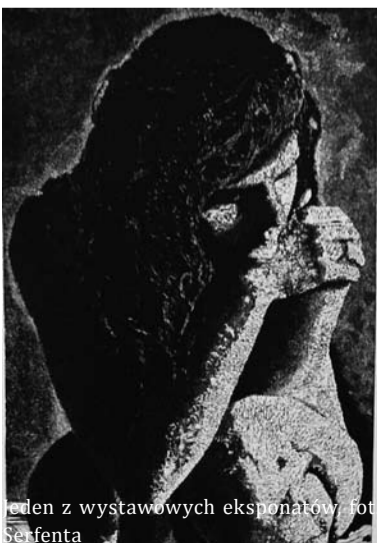
Jeden z wystawowych eksponatów