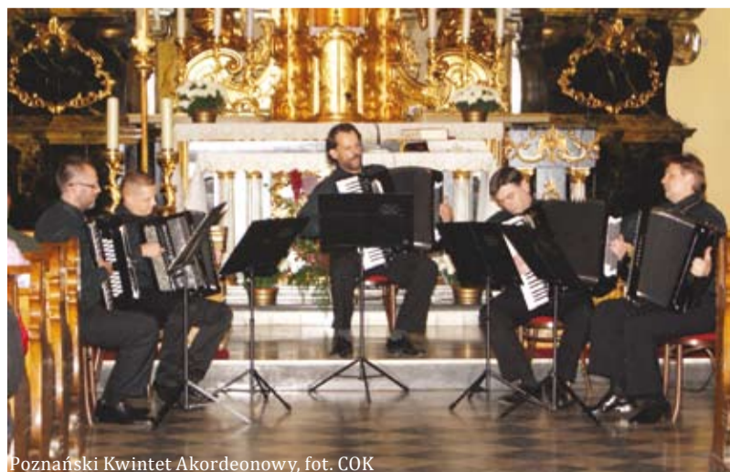
Poznański Kwintet Akordeonowy