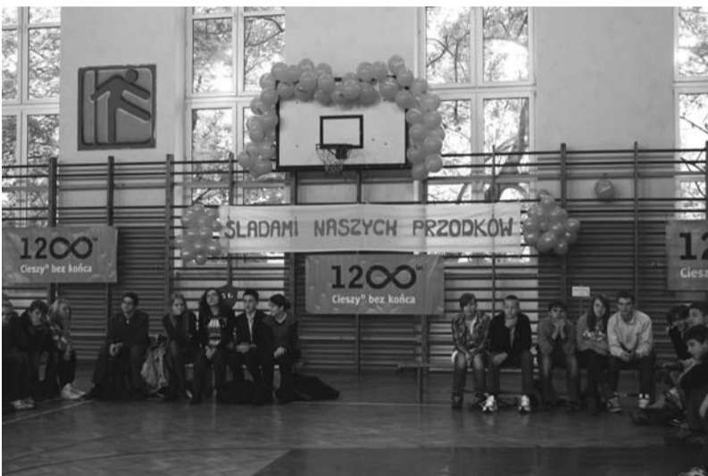
W zawodach udział wzięło sześć pięciosobowych drużyn

Wszystkie drużyny otrzymały pamiątkowe dyplomy oraz nagrody rzeczowe i upominki. Schronisko