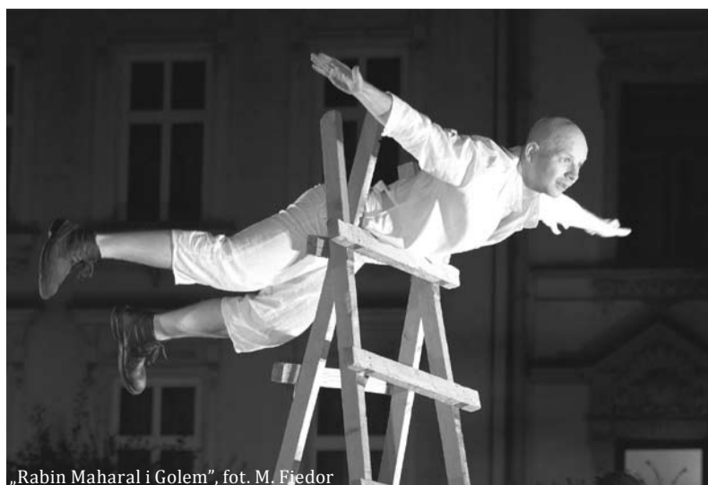
„Rabin Maharal i Golem”