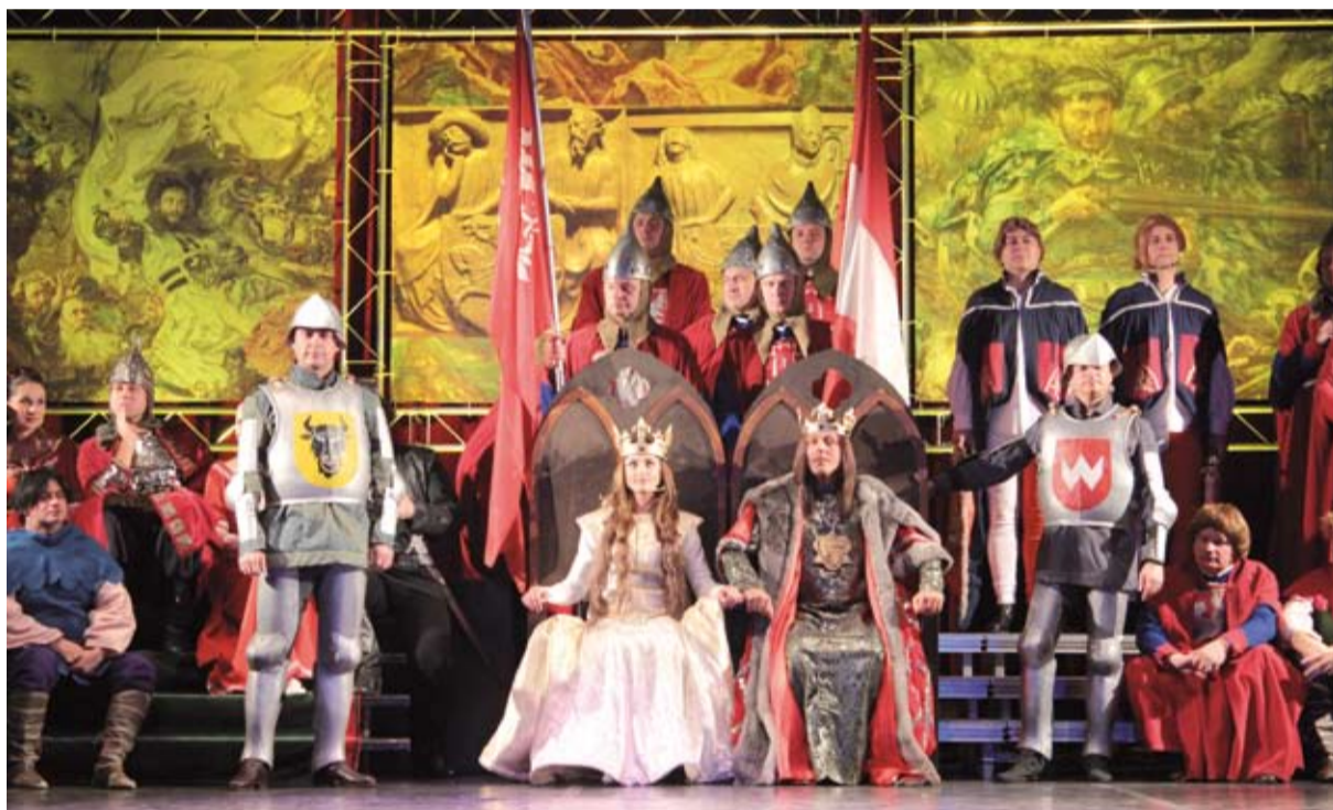
➔ 2 Na scenie królewska para ze swoją świtą

Okazją do wystawienia spektaklu na deskach cieszyńskiego teatru była 92 rocznica powołania Rady Narodowej Księstwa Cieszyńskiego. Rada została utworzona przez grupę polskich działaczy w dniu 19 października 1918 roku. Przyjęta nazwa nawiązywała do tradycji piastowskich Śląska Cieszyńskiego.