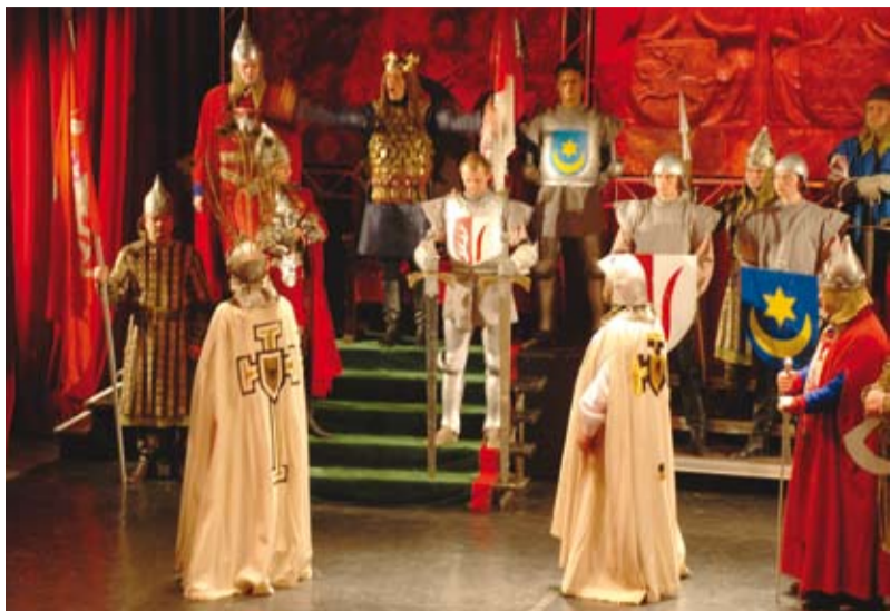
Krzyżacy postowie przed obliczem Władysława Jagiełły