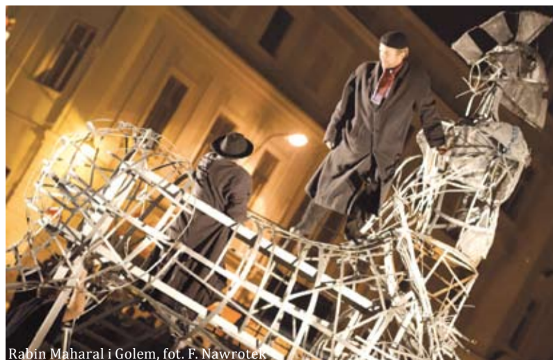
Rabin Maharal i Golem