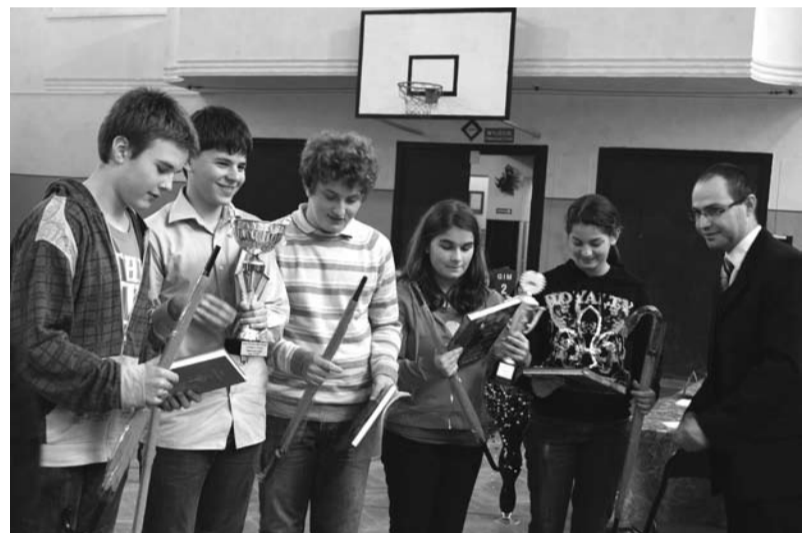
Najlepsze drużyny zostały uhonorowane pucharami i nagrodami rzeczowymi